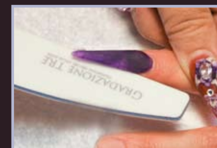
5. Wstępnie opilowujemy paznokieć nadając formę sztyletu.