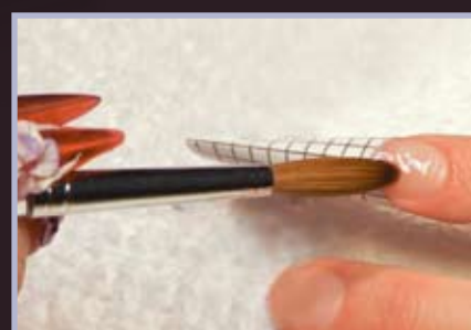
2. Modelujemy wolny brzeg paznokcia w kształcie sztyletu.