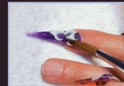
7. Modelujemy z białego akrylu kwiaty.