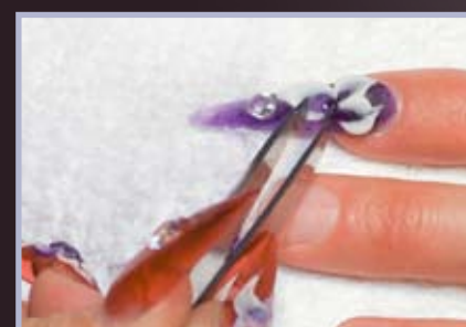
11. Mocujemy na klej zwykły kamienie Swarovskiego.