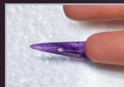
10. Widok paznokcia od spodu.