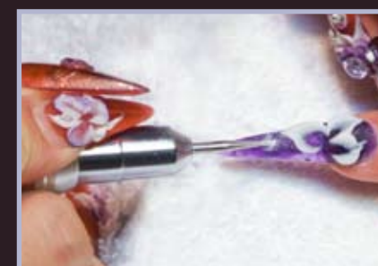
8. Nawiercamy frezarką otwór na biżuterijny, jubilerski kamień.